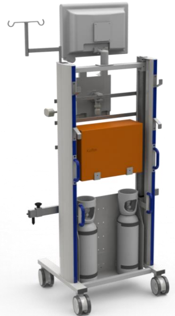
Flexx two configuratie